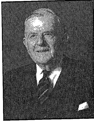
Ei Anrhydedd Dewi Watkin Powell MA LLD

Treuliodd yr awdur ei oes broffesiynol yn y gyfraith fel bargyfreithiwr yn y Deml yn Llundain ac ar gylchdaith Cymru a Chaer ac yna am un flynedd ar hugain cyn ymddeol yn 1992 fel barnwr yn Llys y Goron ac fel Canolwr Swyddogol yn yr Uchel Lys yng Nghymru.